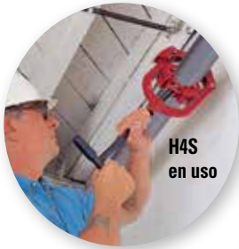
H4S en uso